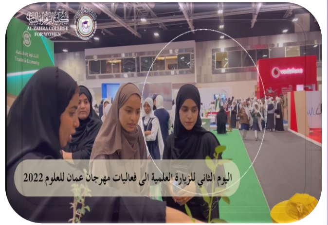
اليوم الثاني للزيارة العلمية الى فعاليات مهرجان عمان للعلوم 2022